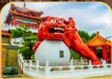
วัดเหวินหนู่