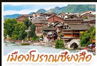
เมืองโบราณเซียงซือ