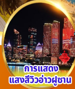
การแสดง แสงสีว้าวผู้ซาน