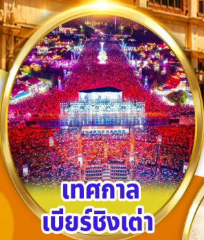
เทศกาล เบียร์ชิงเต่า