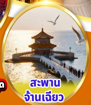
สะพาน จ้านเจียว