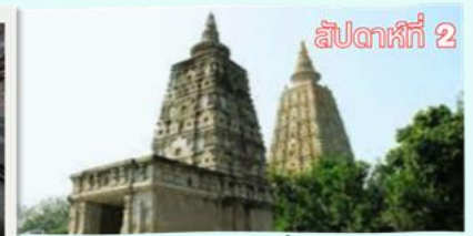
สัปดาห์ที่ 2