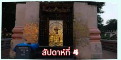
สัปดาห์ที่ 4