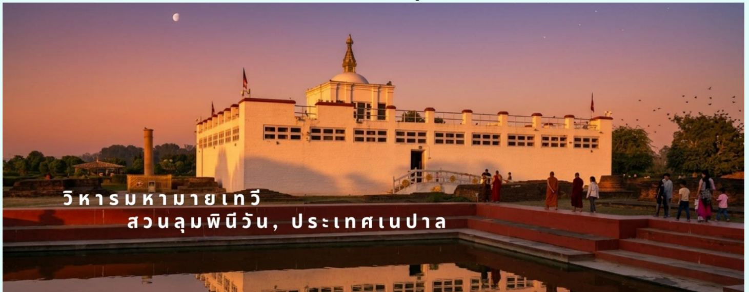
วิหารมหายาเทวี สวนลุมพินีวัน, ประเทศเนปาล

ด้านในมหาวิหารมหายาเทวีไม่อนุญาตให้บันทึกภาพ แต่โดยรอบสวนลุมพินีวัน สามารถถ่ายรูปได้ โดยมีค่าธรรมเนียมกล้องดังนี้ กล้องถ่ายรูปธรรมดา ไม่เสีย กล้องวีดีโอ 10 USD / 800 รูปีอินเดีย / 400 บาท