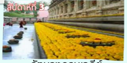
สัปดาห์ที่ 3