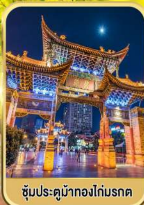
ซุ้มประตูม้าทองไถ่มรดก