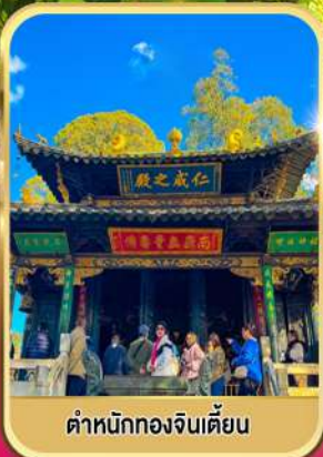
ตำหนักทองจินเตียน