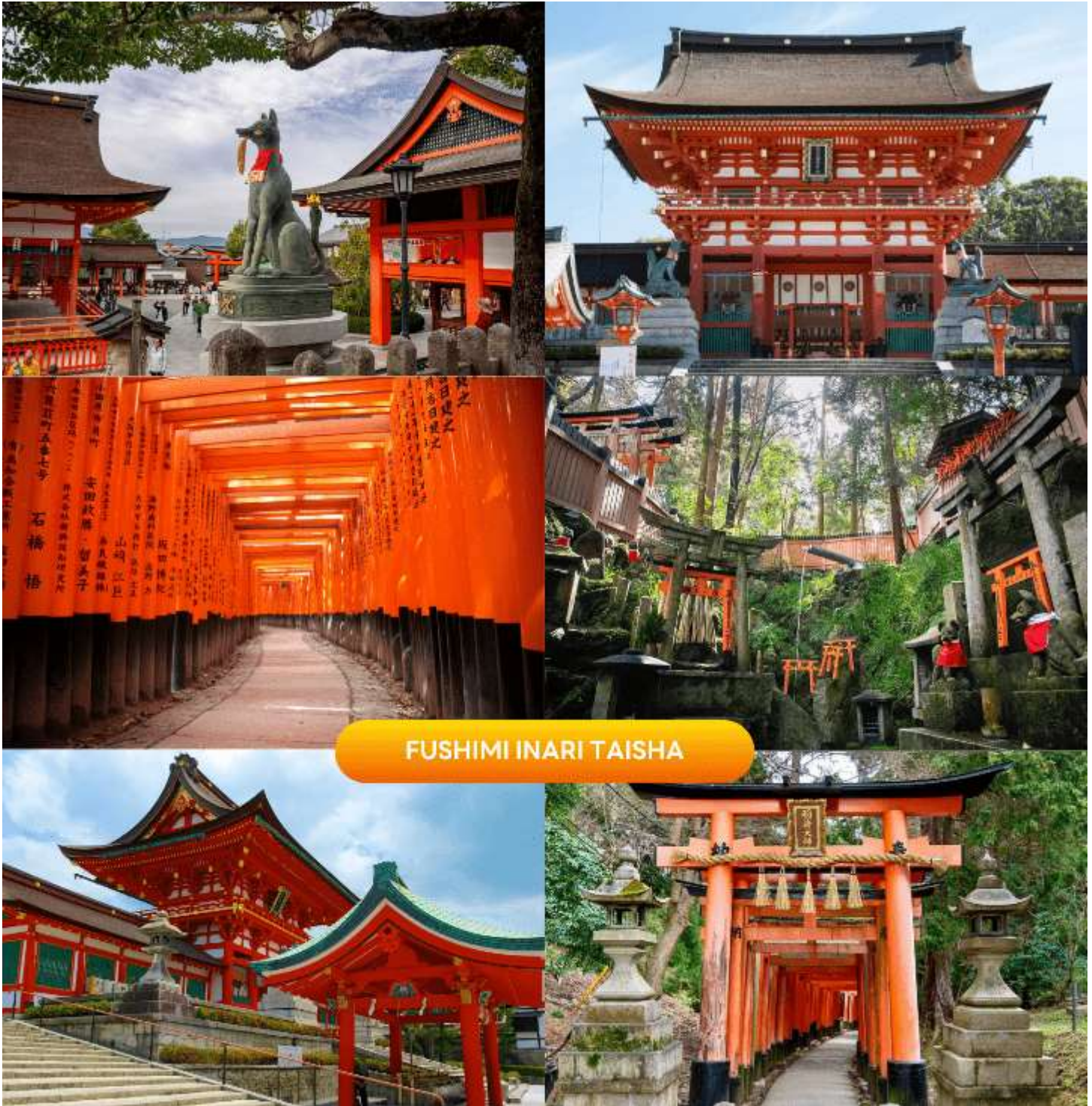
FUSHIMI INARI TAISHA

ญี่ปุ่น ฟุชิมิอินาริไทชะนั้นเป็นทั้งศาลเจ้าของประชาชน และของราชสำนัก เป็นศาลที่พระจักรพรรดิหลายพระองค์มักแวะเวียนมาสักการะตั้งแต่ในอดีต (การเปลี่ยนสีของใบไม้ ขึ้นอยู่กับสภาพอากาศเป็นสำคัญ)