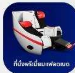
ที่นั่งพรีเมียมแพลาเซนต์