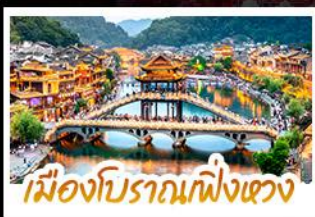
เมืองโบราณกึ่งผาง