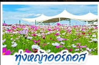
ทุ่งหญ้าแอร์ดอส