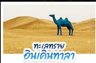
ทะเลทราย อินเคินทาลา