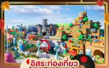
อิสระท่องเที่ยว