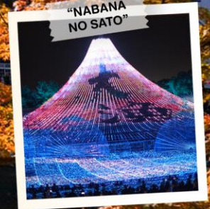
"NABANA NO SATO"

วันเดินทาง 18 - 24 พ.ย. 2569 25 พ.ย. - 1 ธ.ค. 2569