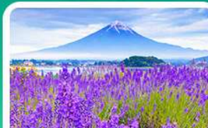
สวนโออิชิพาร์ค