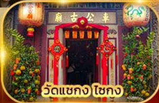
วัดเขangkง ไชกง