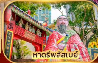
หาดรฟลัสเบย์