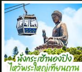
นั่งกระเช้าเองปีง ใจวิพระใหญ่เทียนถาน