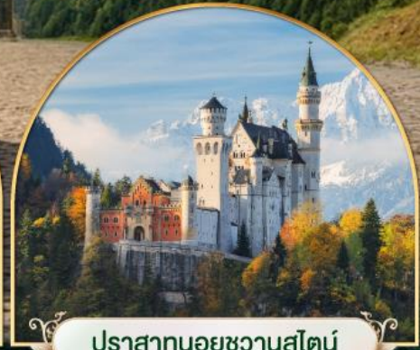
ปราสาทนอยชวานสไตน์ เยอรมนี