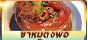
ชาหมุดงพอ