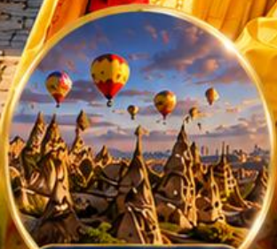
เมืองคัปปาโดเกีย Cappadocia