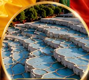
ปามุกคาล่า Pamukkale