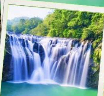
น้ำตกสีเฟิ่น