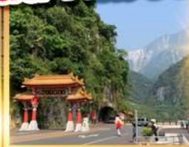
อุทยานทาโรโกะ