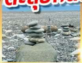
หาดซีชิง

เดินชมวิวเกาะเหอผิง ตะลุยกินตลาดมิชลินเคราเหอ