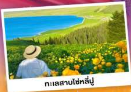
ทะเลสาบไซหลู่