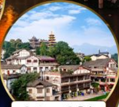
เมืองโบราณฉีโจว