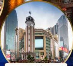
ถนนคนเดินเจียงเป่ย์