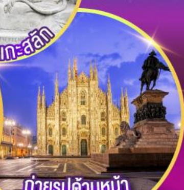
ถ่ายรูปด้านหน้า "มหาวิหารมิลาน"