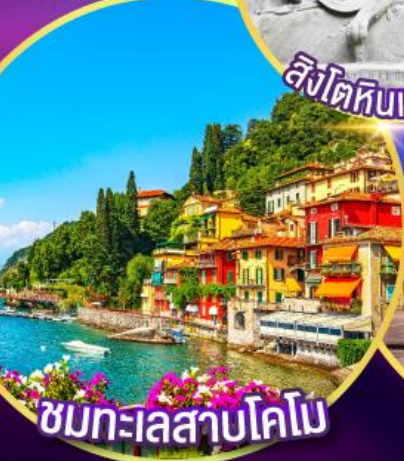
ชมทะเลสาบโคโม