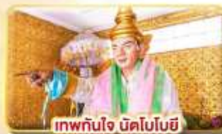
เทพทันใจ นิคโบบิ