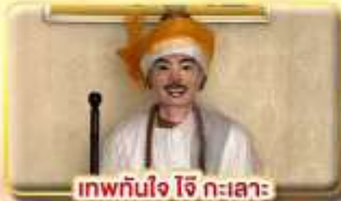
เทพทันใจ ใจกะเลาะ