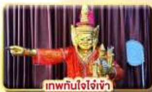
เทพทันใจใจเจ้า