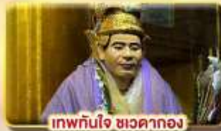
เทพทันใจ ชเวดากอง