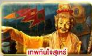
เทพทันใจสุทธร