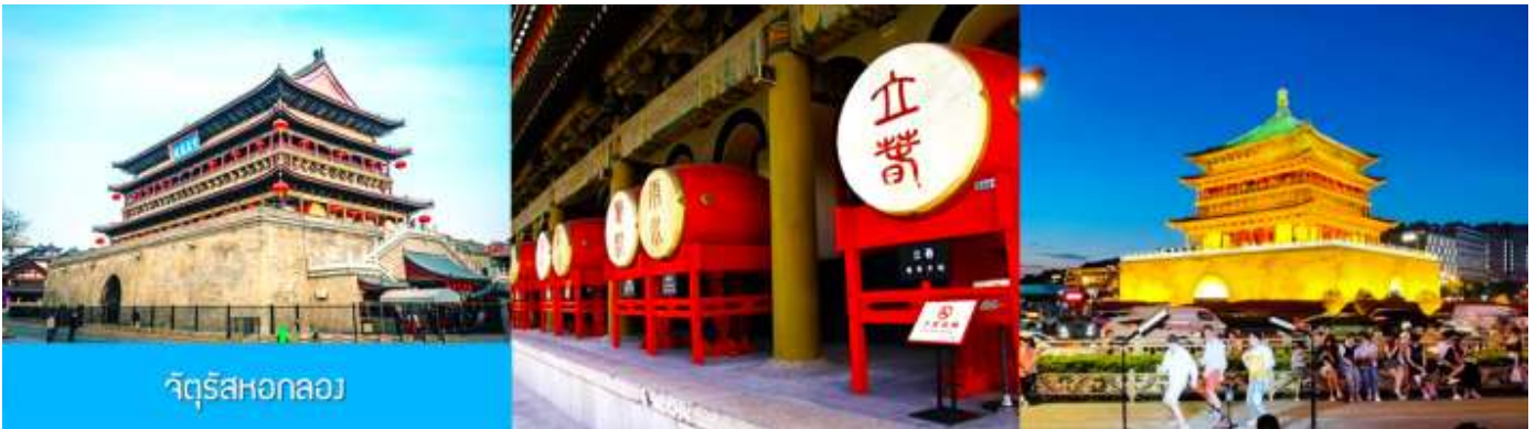
จัตุรัสหอกลอง