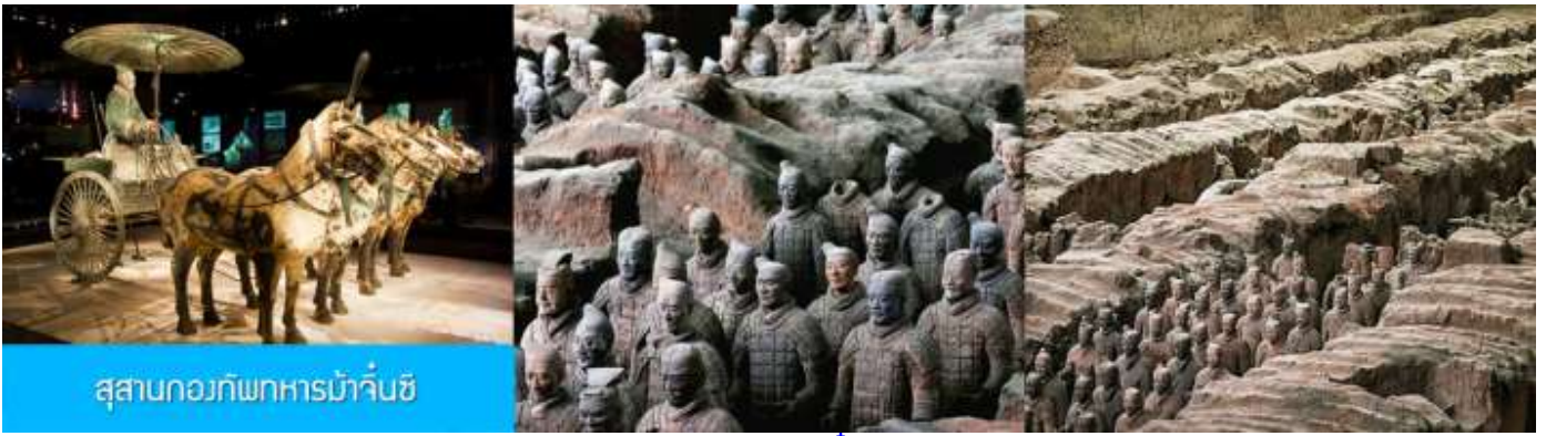
สุสานกองทัพทหารม้าจีน