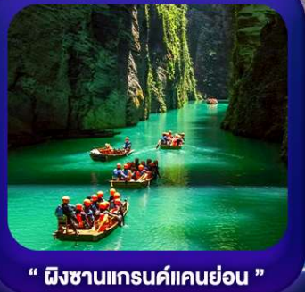
" ผิงซานแกรนด์แคนย่อน "

เที่ยวจีน 2 มณฑล เสฉวน+หูเป่ย์ • ถ้าถึงหลง • หุบเขาสิงโต ซื่อจื่อกวน ล่องเรือมังกรก้งสู่ยชมวิวยามค่ำคืน • ผิงซานแกรนด์แคนย่อน (รวมล่องเรือ) หงหยาดัง • จุดชมรถไฟฟ้าทะลุติ๊ก • ตึกตะเกียบ • สือปาตี • หลงเหมินฮ่าว