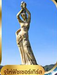
จูไห่ฟิชเชอร์เก็สรา