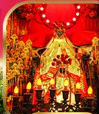
วัดเจ้าแม่กวนอิม อ่องซ่า