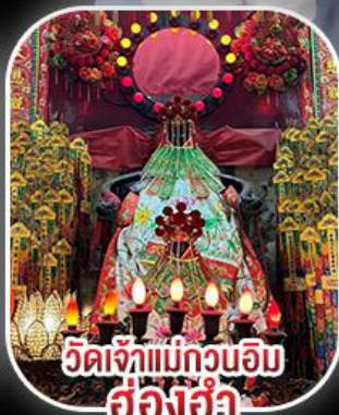
วัดเจ้าแม่กวนอิม ฮ่องฮำ