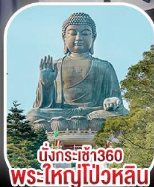
นั่งกระเช้า360 พระใหญ่โป้วหลิน