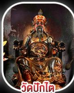
วัดบิกไค