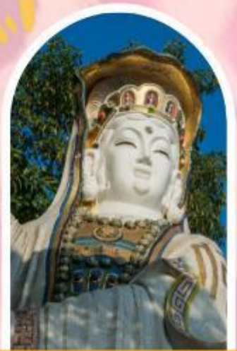
ริพลัสเบย์ รับพลังงานดี เสริมพลังดวงจัญ