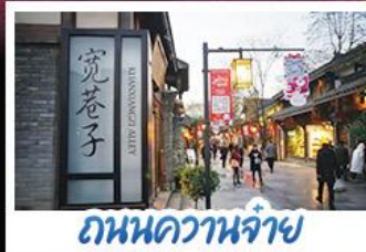
ถนนควานจ้าย