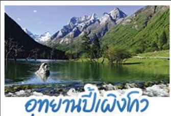
อุทยานปี่เผิงโกว

ภูเขาสึ่ดรุณี อุทยานจิวจ้ายโกว นั่งรถไฟความเร็วสูง น้ำพุไม่ใฝ่ตักSKP อุทยานปี่เผิงโกว วัดต้าฉือ ถนนโบราณชอยกว้างชอยแคบ ช้อปปิ้งถนนไถ่กู่หลี่ + ถนนชุนชี่ลู่