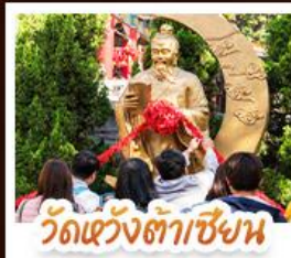
วัดเซ่งเต้าเซ็ง