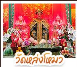
วัดเล่งโง้ว

นั่งรถรางฟ้าแถมสู่ TOP OF PEAK • ซอปปิงจุใจมงกิก และ CITYGATE OUTLAETS • นั่งกระเช้ามองปิง สักการะพระใหญ่เทียนถาน • จอพรเจ้าแม่หล่งโหมว แม่กอง 5 มิงกร ให้ประสบความสำเร็จในทุกๆ ด้าน