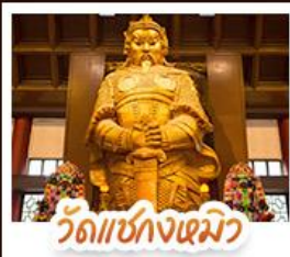
วัดเชกวง