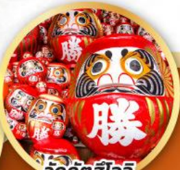
วัดคัตสึโฮจิ (วัดदारุมะ)

ชมความงามของกำแพงหิมะ เส้นทางสายอัลไพน์ทาเคยาม่า (JAPAN ALPS SNOWWALL)