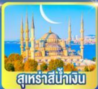
สุหรัสีน้ำเงิน