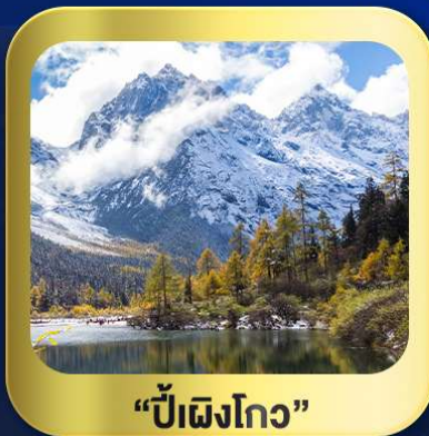
“ปี้ฝิงโกว”