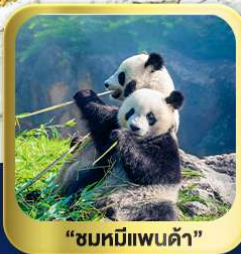
“ชมหมีแพนด้า”