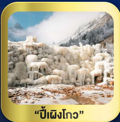
“ปี้ฝิงโกว”

นั่งกระเช้าชมวิว ภูเขาหิมะ-ต้ากู่กลาเซียร์ • ชมความสวยงาม ณ อุทยานปี้ฝิงโกว ห้องสมุดจงชู่เก๋อ • ศูนย์หมีแพนด้า • ตงเจียวจี้ • ซอยกว้างชอยเคบ