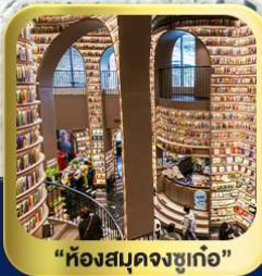
“ห้องสมุดจงชู่เก๋อ”