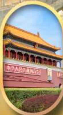
จัสมุติสเทียนอันเหมิน