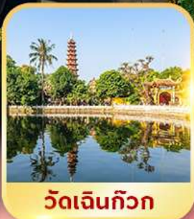
วัดเงินทิวาก