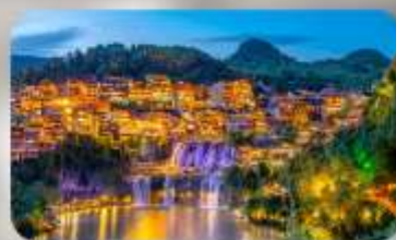
เมืองโบราณฟุทงเจิน