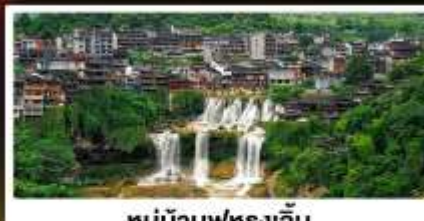
หมู่บ้านฟุรงเจิน