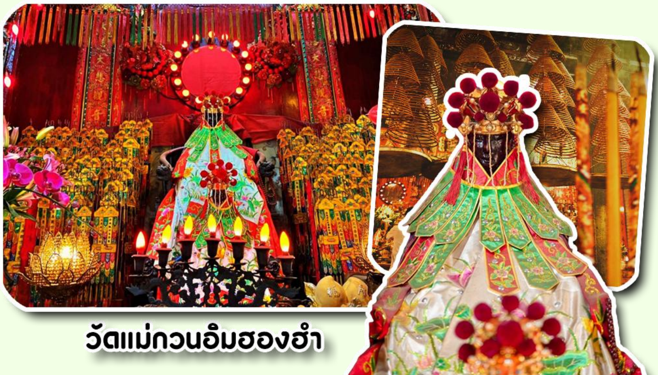
วัดแม่กวนอิมสองฮำ

ฮ่องกงสร้างตั้งแต่ปี ค.ศ. 1873 เป็นวัดขนาดเล็กที่มีชาวฮ่องกงศรัทธานับถือกันเป็นอย่างมากวัดแห่งนี้เป็นที่ ประดิษฐาน องค์เจ้าแม่กวนอิมสองฮำ ที่มีชื่อเสียงเรื่องการให้กู้ยืมเงินเชื่อกันว่าท่านช่วยพลิกฟื้นเศรษฐกิจของชาวฮ่องกง ผู้คนจึงนิยมมาเยี่ยมเงินทำธุรกิจจนสำเร็จร่ำรวย รุ่งเรืองโดยให้ท่านอธิษฐานขอพรต่อหน้าเจ้าแม่กวนอิมสองฮำพร้อมกับระบุ วันเวลาในการขอพรด้วย จากนั้นนำธนบัตรตามฐานะและศรัทธาที่เราจะนำเป็นสื่อในการขอพร เขียนจำนวนเงินที่ต้องการ ลงไปด้วย ใส่สกุลเงินยิ่งใหญ่ แล้วนำเงินใส่ในซองแดง ควรเตรียมซองแดงไปเอง นำซองแดงไปวนรอบกระถางรูป วนขวา จำนวน 3 ครั้ง แล้วเก็บซองแดงในกระเป๋าสตางค์ เป็นเงินขวัญถุง ถ้าประสบความสำเร็จตามที่มุ่งหวังให้นำเงินในซองแดง ทำบุญหยอดตู้ที่วัดแห่งนี้ในโอกาสต่อไป