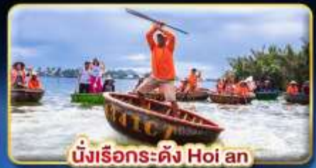
นั่งเรือระดั่ง Hoi an