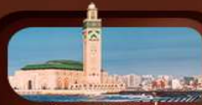
มัสยิดฮัสซันที่ 2