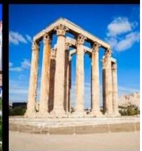
Temple Of Olympian