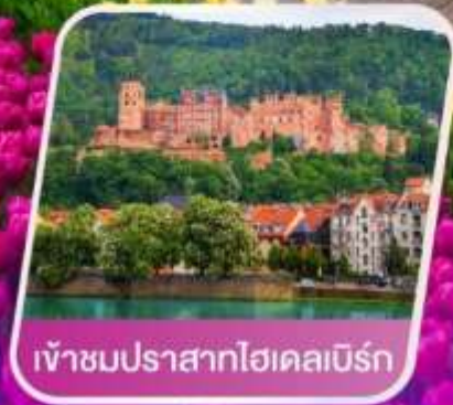
เข้าชมปราสาทไฮเคลมเบิร์ก