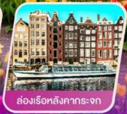
ล่องเรือหลังคากระຈก