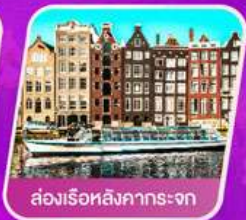
ส่องเรือสิงคารถะจก

เที่ยวเทศกาลดอกไม้เคอเคนฮอฟ ชมแคว้นอาลซัส หมู่บ้านสวยที่สุดในฝรั่งเศส เยือนเมืองมรดกโลก