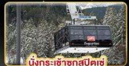
นั่งกระเช้าชุกสปีตซ์