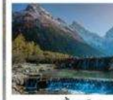
อุทยานปี้เพิงโกว