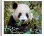
ศูนย์หมีแพนด้าดูเจียงเยียน