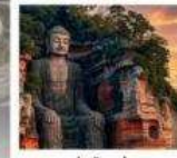
หลวงพ่อดาเล่อซาน