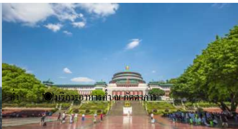
ค่ำ ☉ บริการอาหารค่ำ ณ ภัตตาคาร