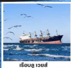
เรือลู เวยส์