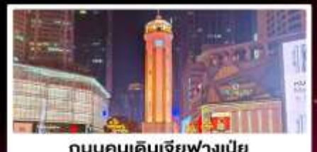
ถนนคนเดินเจียฟางเปี่ย