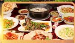
อาหารสลัดกวางตง