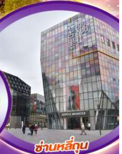
ชานหลี่กุน