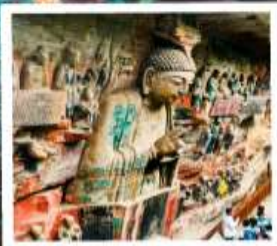
ฉาหินแกะสลักต้าจู้